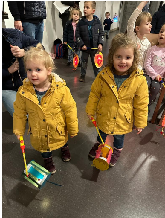
St. Martins-Umzug mit den Eltern