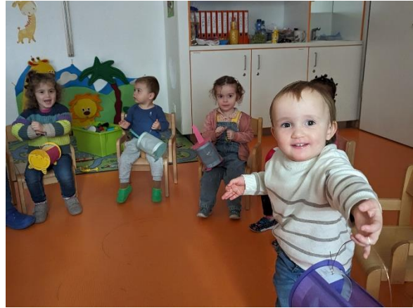
Morgenkreis mit den St. Martins Laternen