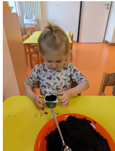
Angebot: Kresse ansäen