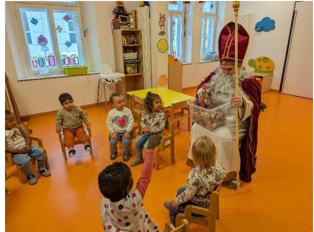
Der Nikolaus kommt!