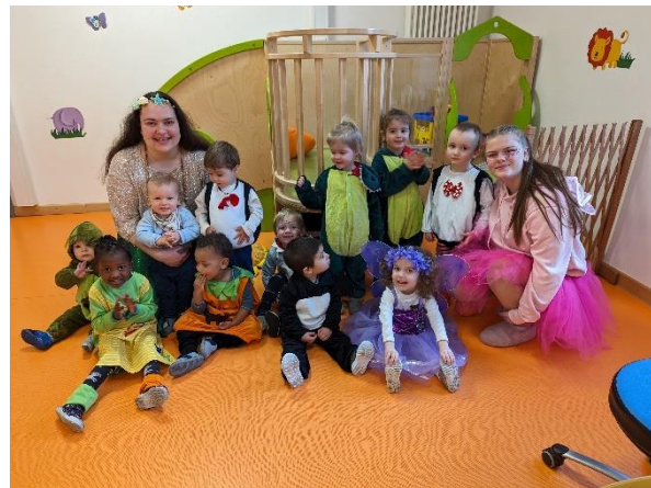
Unsere Faschingsfeier am 13.02.24