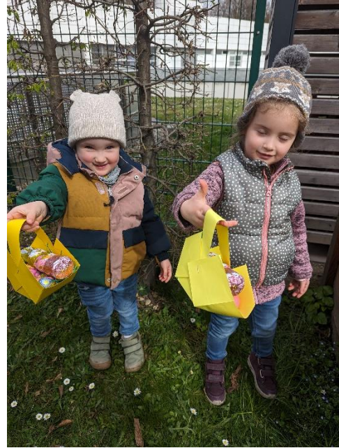
Der Osterhase war da! (26.03.2024)