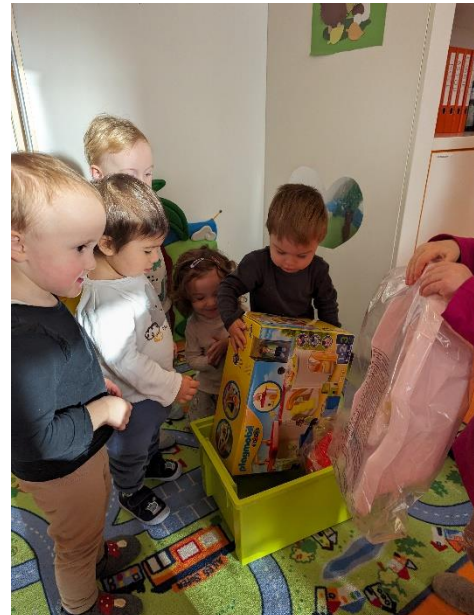
Das Christkind war da!