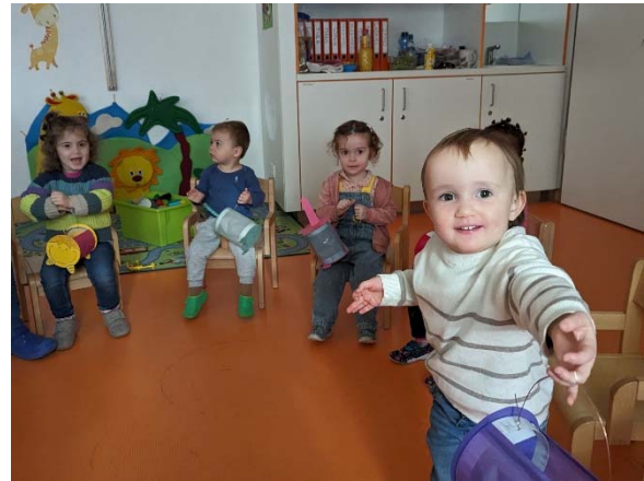
Morgenkreis mit den St. Martins Laternen