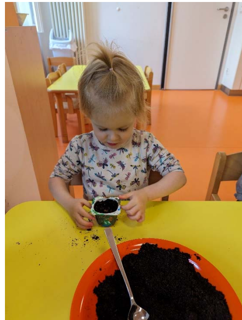
Angebot: Kresse ansäen