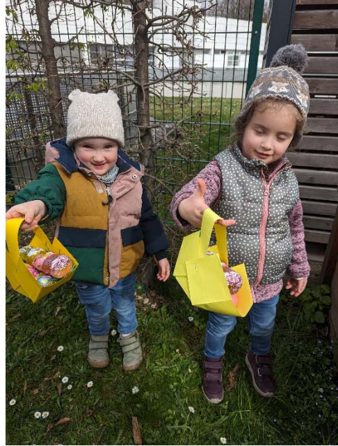
Der Osterhase war da! (26.03.2024)