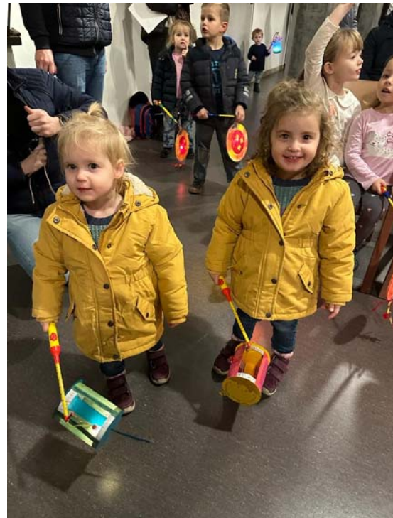
St. Martins-Umzug mit den Eltern