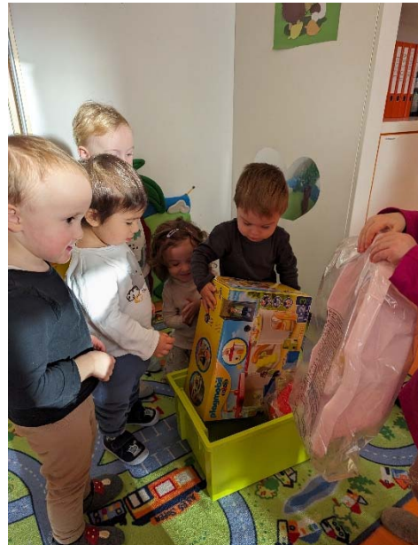
Das Christkind war da!